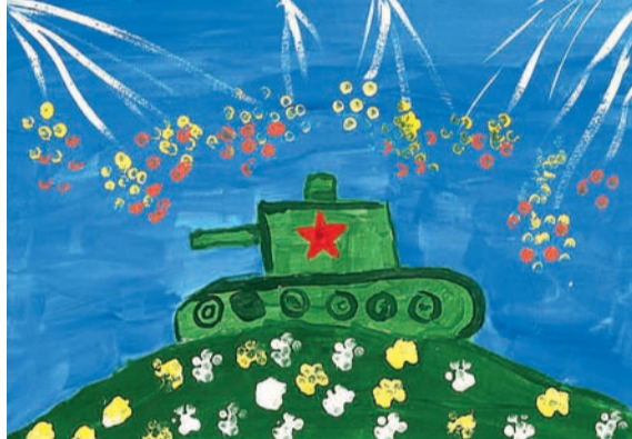
«Салют Победы». Степа Казаченков, 5 лет