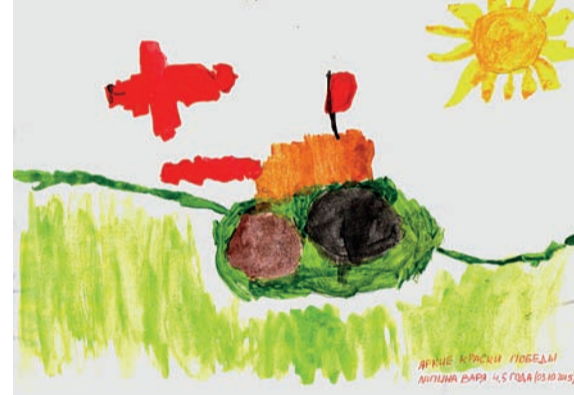
«Яркие краски Победы». Варя Лапина, 4 года