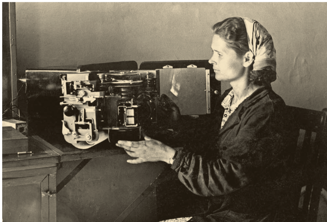
За работой в цехе тепловой автоматики и измерений на Новочеркасской ГРЭС

Она рано узнала, что такое тяжелый труд, — еще подростком пошла работать в сельхозартель. Наравне со всеми ездила на лесопильный завод, который стоял на протоке Оби, грузила на пароходы длинные тя-